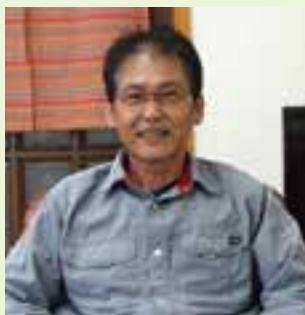
愛顔で答える下野社長

今回、平成25年度に普通会員として入会していただきました、「株式会社クリーンサービス伊方」を紹介いたします。