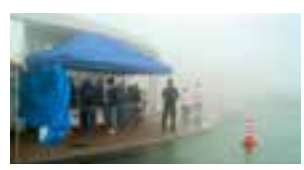
雨にも負けず、風にも負けず、霧にも負けず頑張りました！