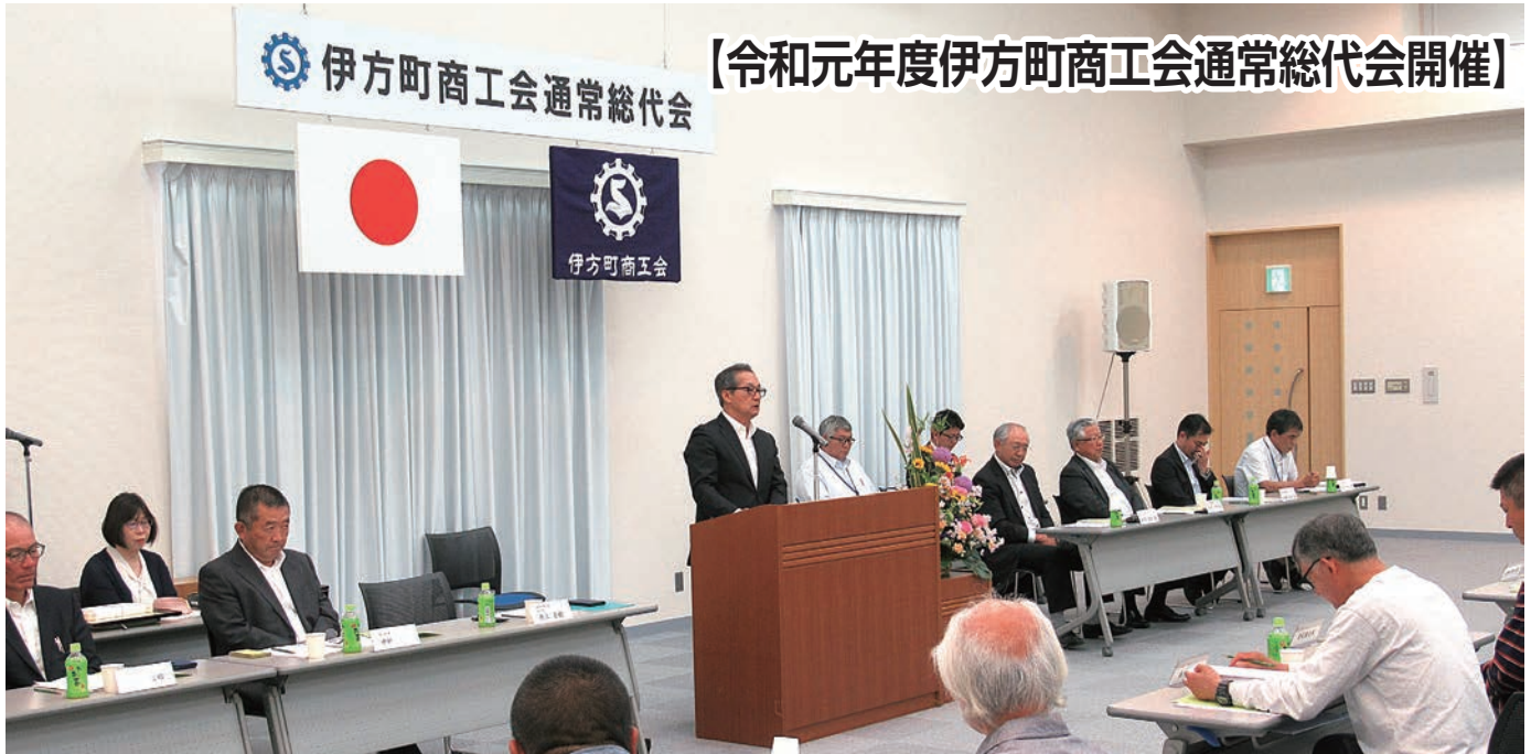
【令和元年度伊方町商工会通常総代会開催】