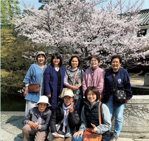
倉敷美観地区にて

桜が咲き誇る4月7日、倉敷美観地区での散策、旧野崎家住宅見学、児島ジーンズストリートでの買物など楽しみました。