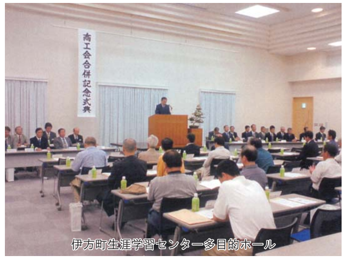
伊方町生涯学習センター多目的ホール