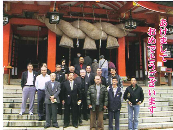
平成21.11.27 理事総代旅行 日本五大稲荷 太鼓谷稲成神社(山口県津和野町)

されます。前回は愛媛県内では最高の決定率でありました。今回は、決定率よりも、真に結婚に迫られている方に重きをおき、男性の募集年齢を前回の20歳以上から30歳以上に、女性も24歳以上にしました。今後の推移を見守り、地域のために、法人会とともに辛抱よくこの事業にも取り組んでいきます。